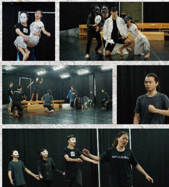
《追月狂君-卡里古拉》排練照片