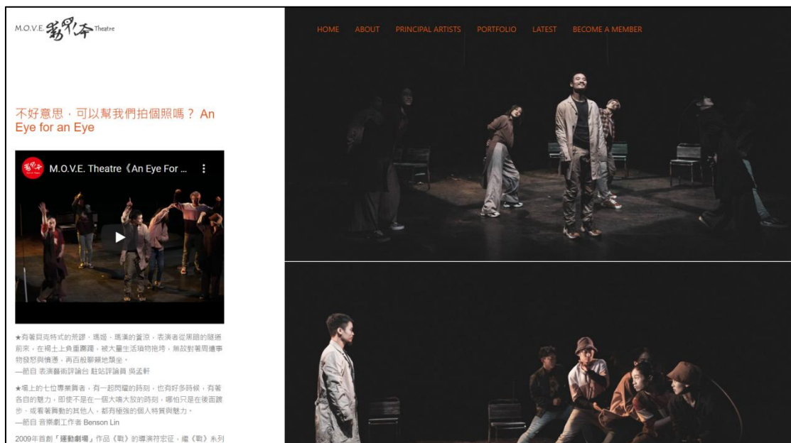
圖 2：《不好意思，可以幫我們拍個照嗎？》網站截圖