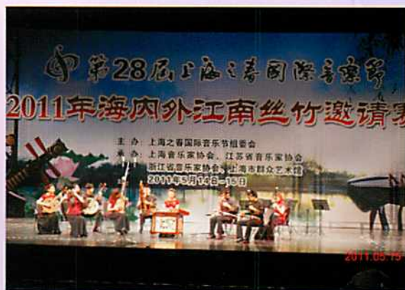
【第28屆上海之春國際音樂節】