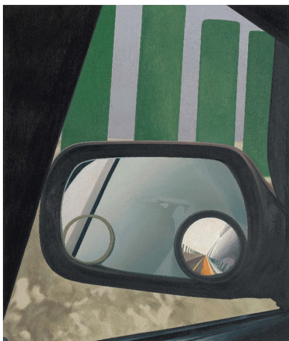
後視鏡 / 53 x 45.5 cm / 油彩、水性樹脂顏料、麻 / 2023