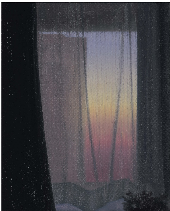
橫濱黎明 / 27 x 22 cm / 油彩於麻布 / 2023