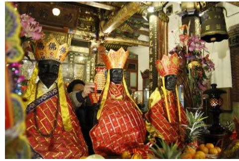
分身眾多是臺灣神明的特色