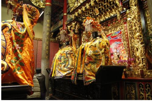
具有眾多分身的關渡二媽