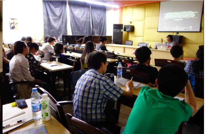
D. 黃信堯導演課程現場 2