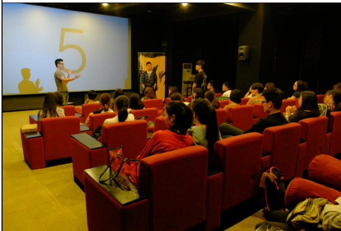
E. 中國美術學院 象山校區 4 號樓 205 視聽室