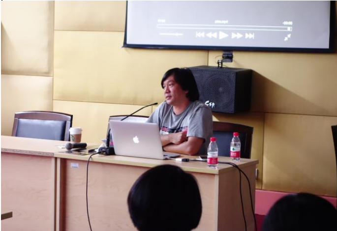
C. 黃信堯導演課程現場 1