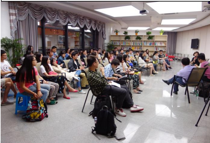
A. 浙江工商大學／教師教學發展中心