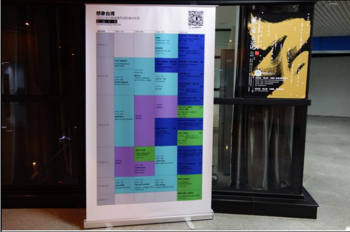
A. 浙江工商大學放映場地場佈