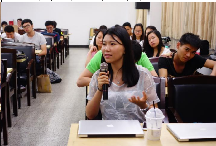
H. 曾文珍導演課程現場 3：學員提問