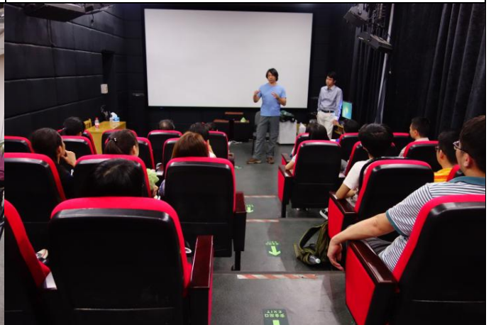
B. 浙江大學／西溪校區東衝教學樓三樓放映室