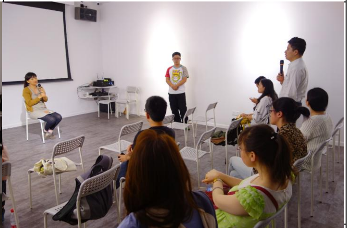
D. 《失婚記》映後：觀眾交流 1