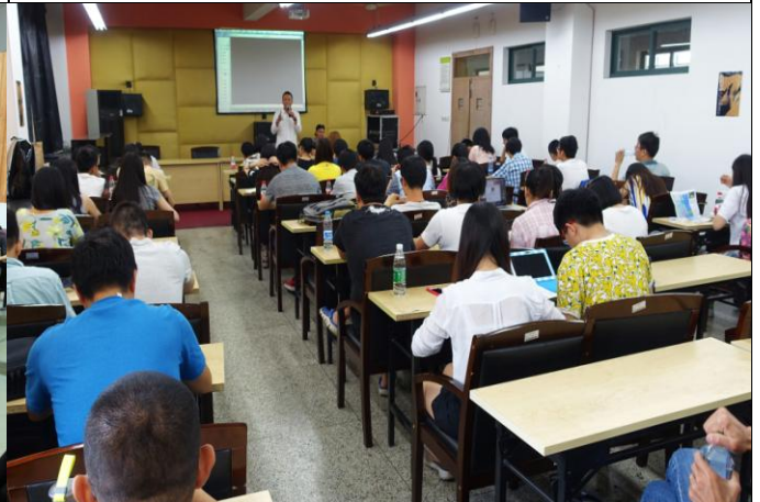
D. 浙江傳媒學院／第一實驗樓 220