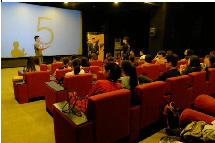
I. 《25歲，國小二年級》映後現場