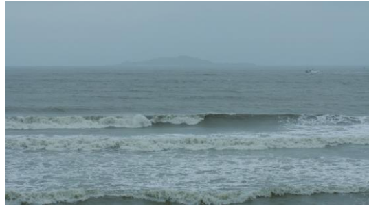
以上為作品影片影格擷取