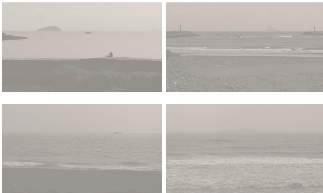
以上為作品數位輸出圖片