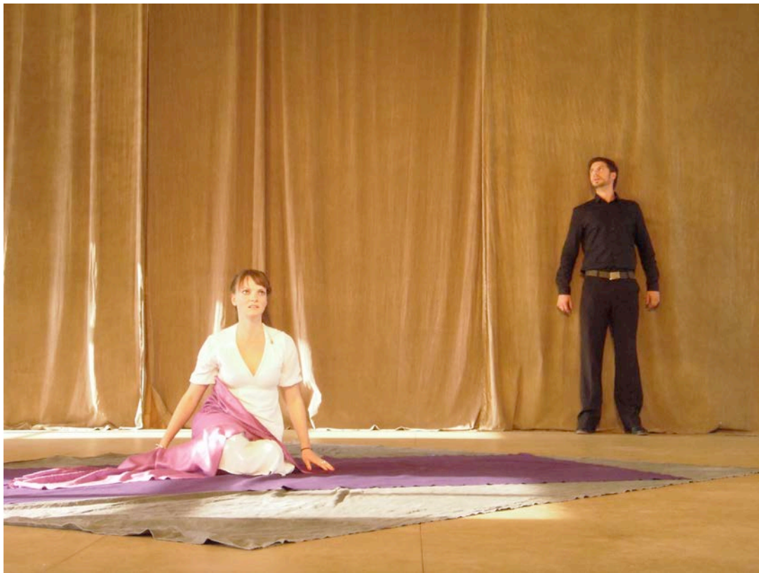
莎士比亞的《奧瑟羅》片段徵選