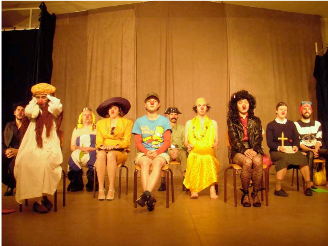
法式個性小丑，裝扮幫助找到屬於自己的小丑