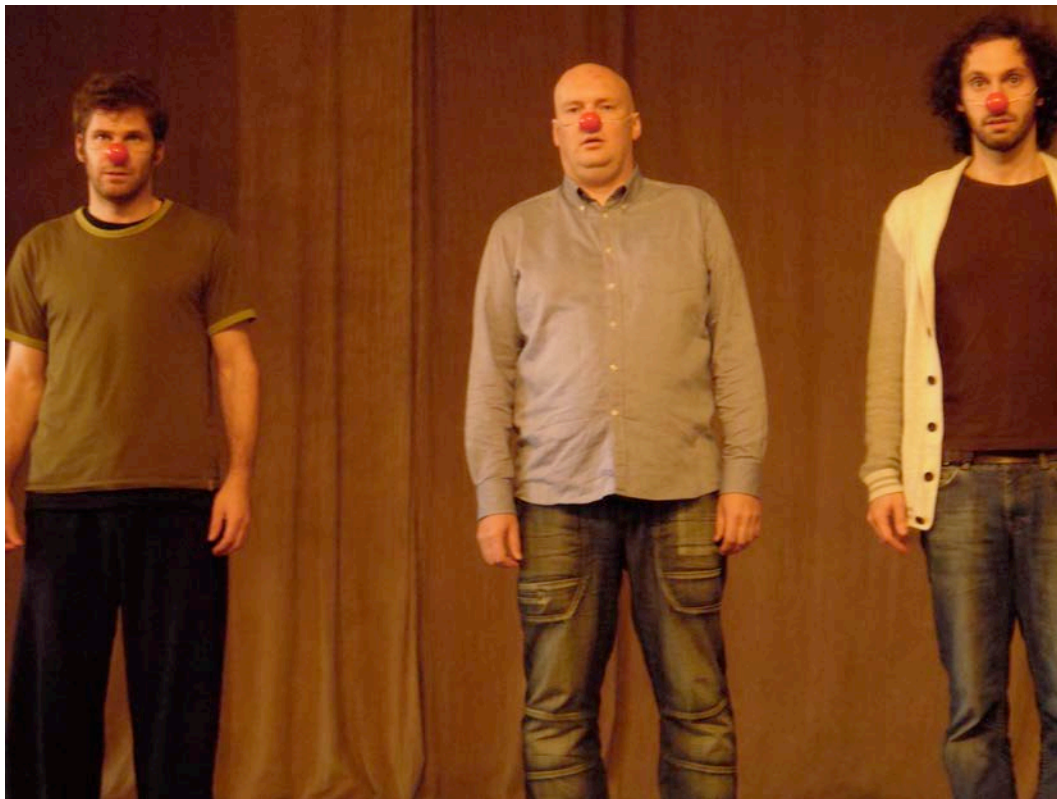
紅鼻子小丑的練習—秀出你的愚笨