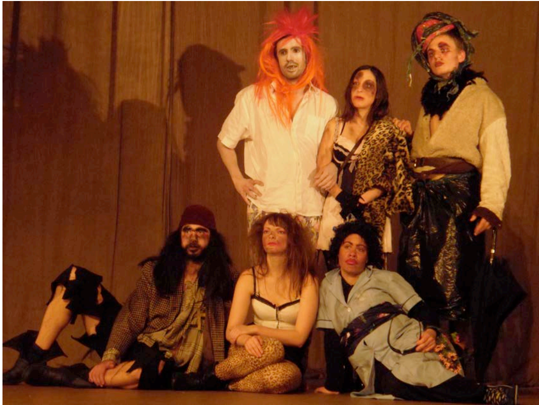
同學們自創、自編的現代Bouffon角色及劇本