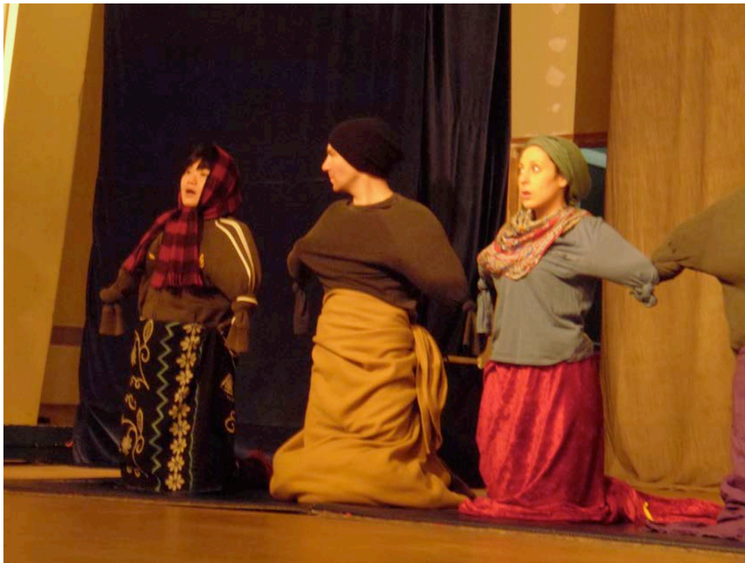
中古世紀的Bouffon練習之侏儒篇