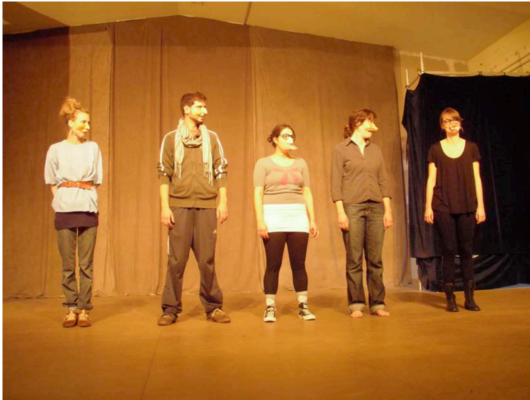
紅鼻子小丑的概念建立一派對面具練習