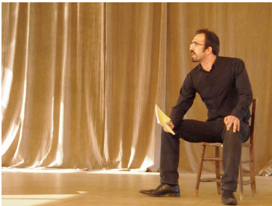
契克夫《櫻桃園》羅巴金角色甄選練習