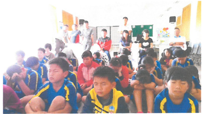
聆聽不同空間中的東北季風聲響