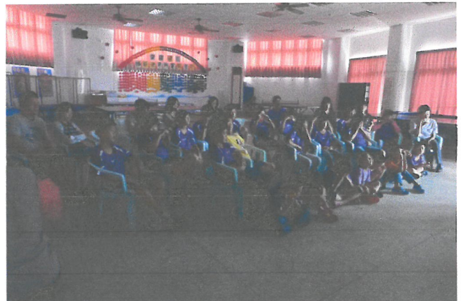
觀看萬那杜群島婦女以海為鼓的傳統音樂影片