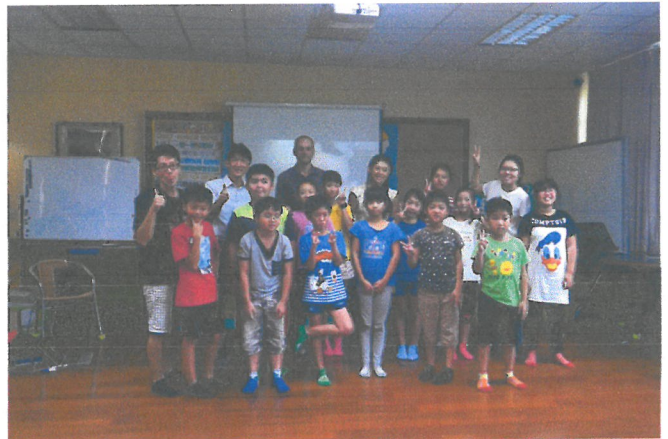
觀看海洋科學影片先驅 Jean Painlevé 的影片片段