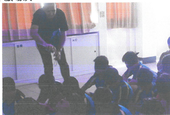
每次活動都會有的開場即興聲音表演(矇住眼睛)