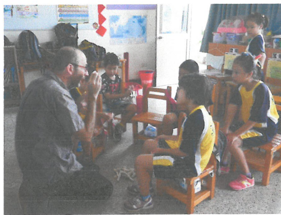
珊瑚碎塊的聲音體驗