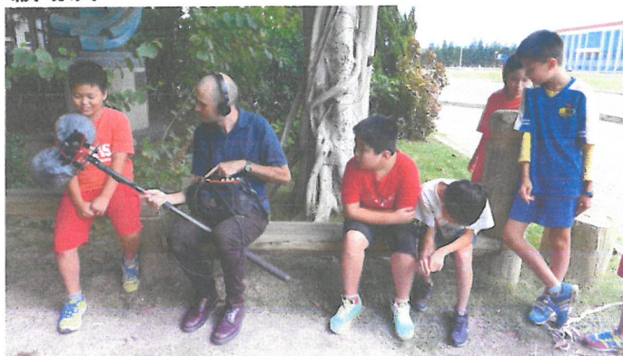
活動後的海洋主題訪錄(藝術家與受訪學生)