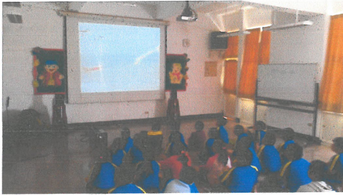
觀看英國藝術家的海岸風力聲音裝置紀錄