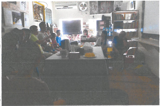
(左)工作坊成果影片播映 (右)與會來賓(社區工作者/海洋研究者...等)分享個人的經驗及觀察