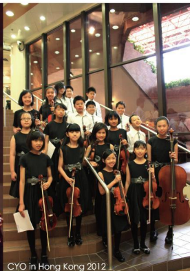
CYO in Hong Kong 2012