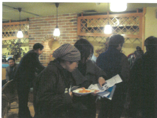
現場的民眾都很用心的對所看到的作品發表自己的想法，並與藝術家做討論。

而在當天的活動結束之前，負責人本田先生特地對在場的來賓謝謝我遠道而來，這次的交流讓他們有機會更了解台灣的年輕創作者，更有民眾希望我還能再到他們岐阜去展出，而我也謝謝他們對於此次