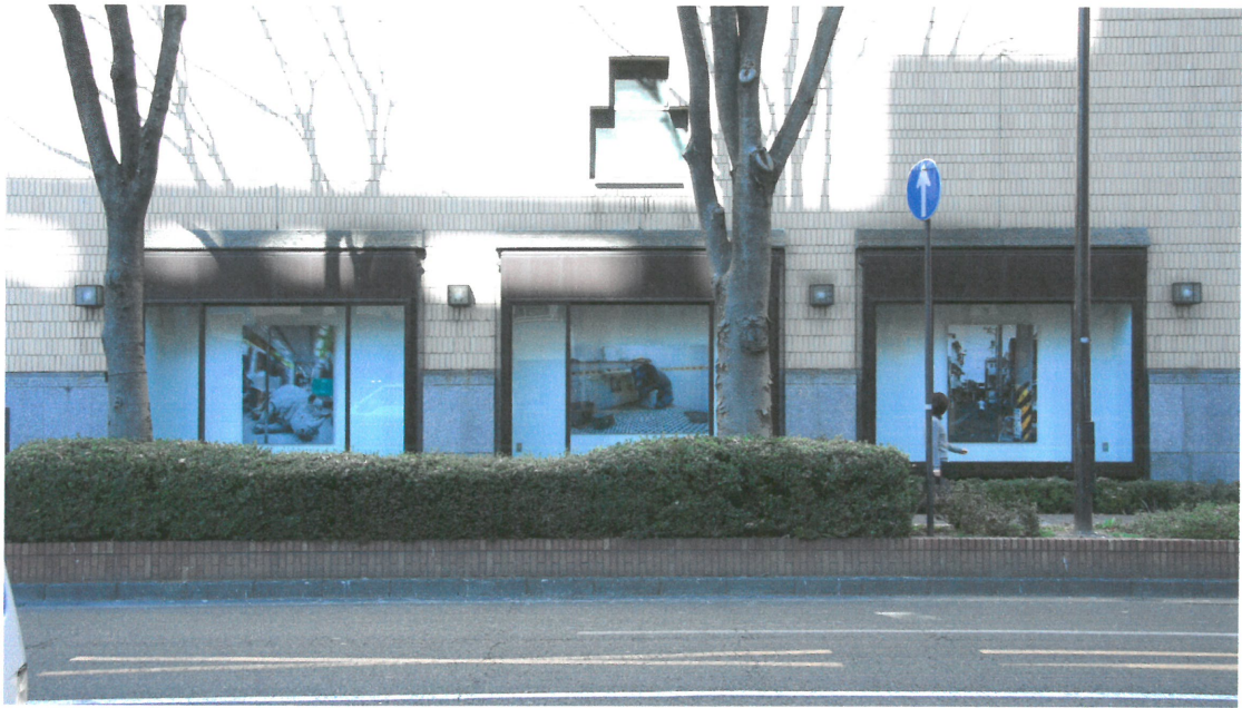
展出的作品面向街道，來往的民眾都會在經過的時候看到這次展出的作品