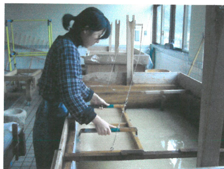
參觀日本美濃和紙博物館，及和紙製作的示範。