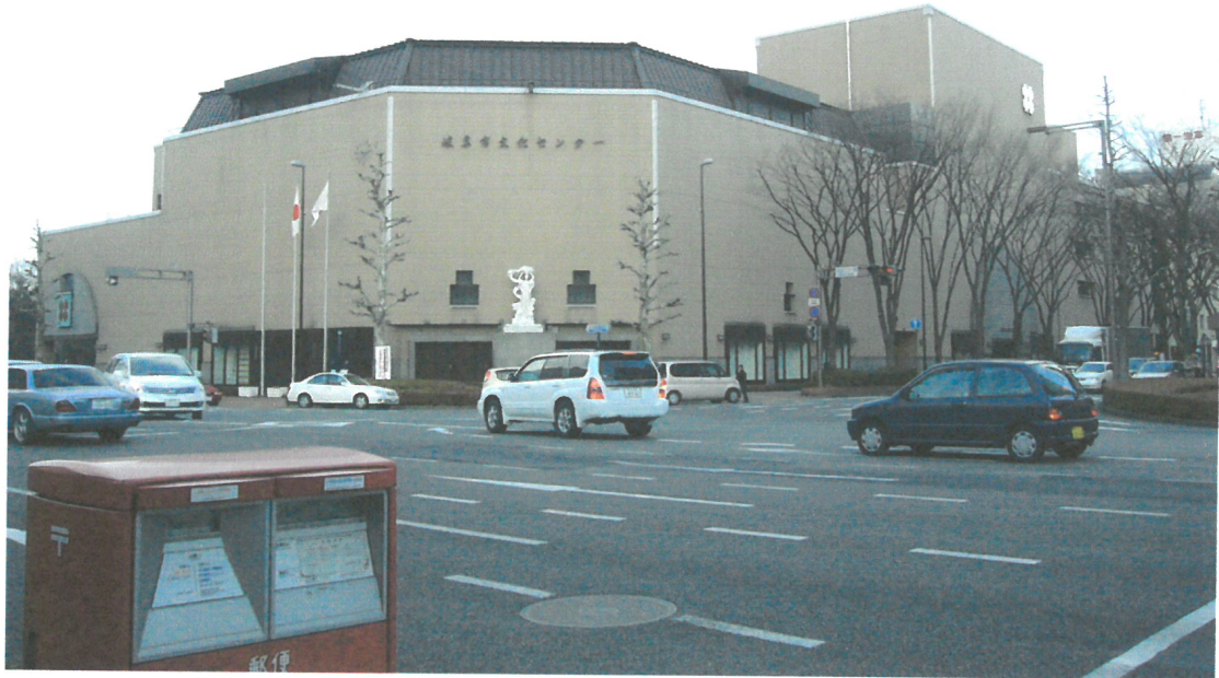
岐阜市立文化中心

岐阜市市中心的鬧區，市區內的交通相當便利，不僅有名古屋所直營的新幹線，也有日本國營的 JR 新幹線經過，不論是到此處觀光的的遊客或是當地的民眾，每日來往於此的人群相當多，加上我所展出的空間面向街道，因此只要經過岐阜市立文化中心必定會看到作品。