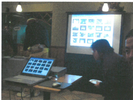
現場播放各個藝術家的簡歷與作品資料介紹，館方並準備了餐點，讓現場的來賓與民眾對話。