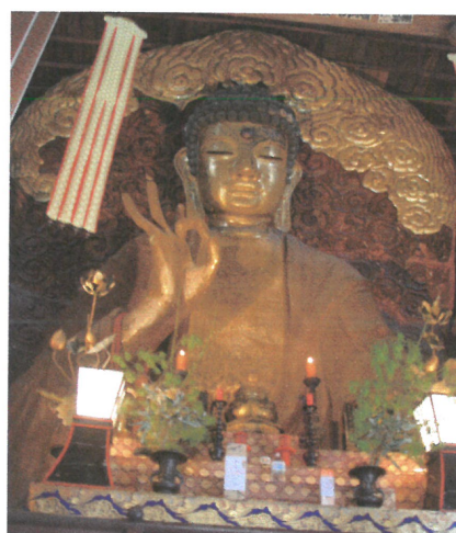
日本三大古佛之一，岐阜大佛。