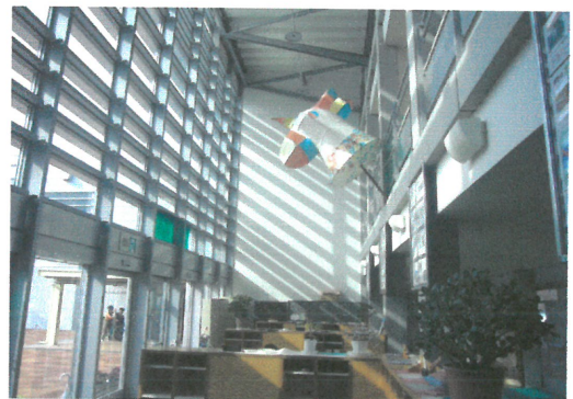
藝術家日比野克彥「明後日朝顏」系列作品。

間，就像在美術館裡生活一樣，而「學校美術館」這一計劃已執行了六屆，不僅全校師生相當滿意，甚至當地的許多民眾在假日都會把這一個學校當作是美術館來參觀，因此也讓學校