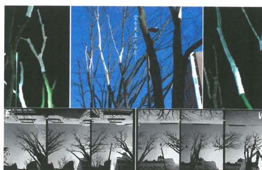
2009 年 2 月展出藝術家 ENZO 先生及其作品圖錄。