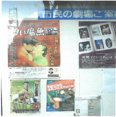
表演類別活動宣傳