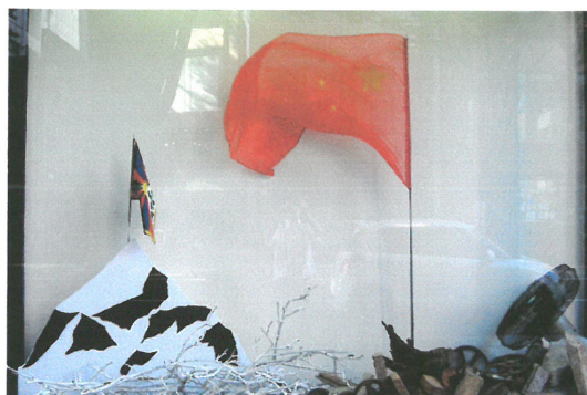
2008 年 7 月展出藝術家安藤治先生及其裝置作品。