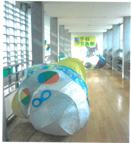
岐阜縣立關特別支援學校的「學校美術館」。學校內隨處可見的藝術家與學生共同創作的作品。