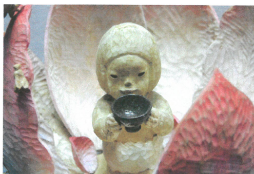
2008 年 4 月展出藝術家深田庸子小姐及其創作作品。