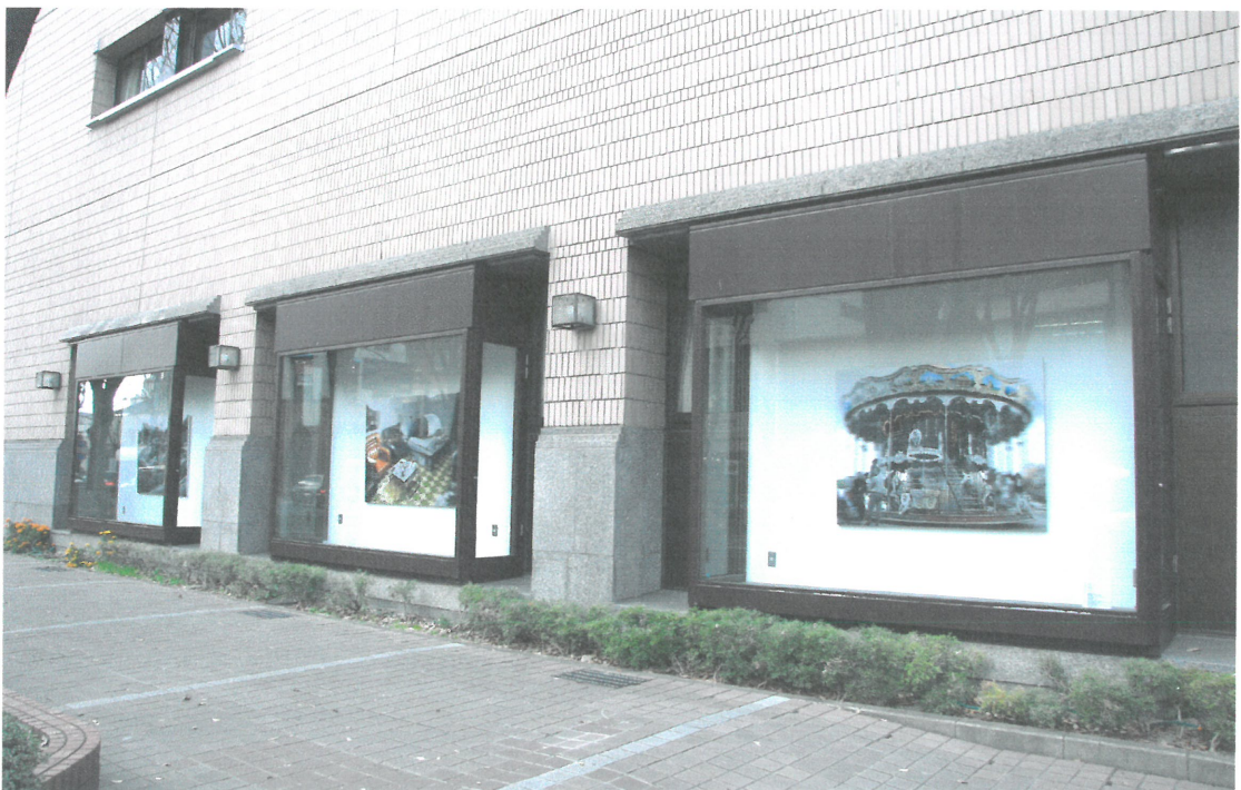
開放式的展出空間，也讓民眾有較多的機會認識作品