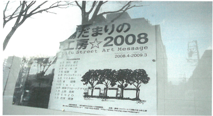
美術類別 2008 年度展出藝術家宣傳