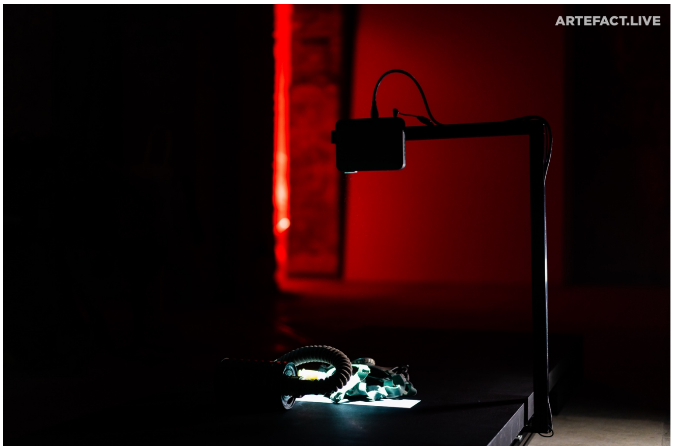
《Seen/Unseen- Entropy n°1[Chernobyl 33 現地製作版]》作品局部（廢墟內的防毒面具）

受邀參與展出的作品是《Seen/Unseen- Entropy n°1[Chernobyl 33 現地製作版]》，由《Seen/Unseen- Entropy n°1》（見下圖）發展改作的現地製作版本，將以車諾比核電廠所在 Pripyat 城鎮遺棄住宅內的照片、生活物件作為掃描物取代原作的花崗岩，在掃描裝置上裝設有蓋格偵測管偵測放射值，以及微型攝影機和微型投影機，將即時拍攝到的照片/物件以微型投影機投射出來，投影畫面並結合即時輻射偵測數據疊合呈現。