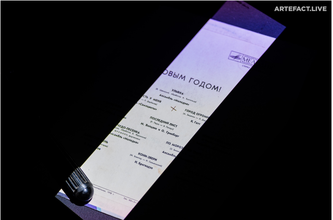
《Seen/Unseen- Entropy n°1[Chernobyl 33 現地製作版]》作品特寫（廢墟內的黑膠唱片封面）