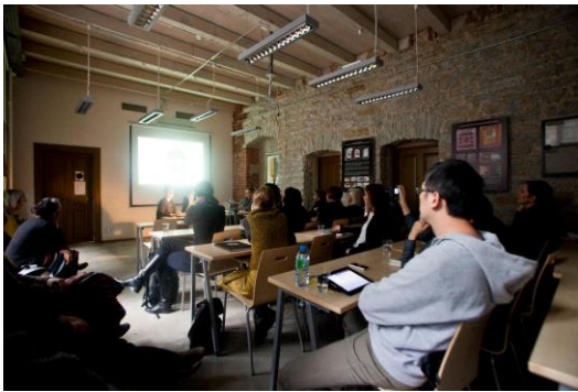
*藝術家見面會暨作品交流。