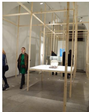
*以木條搭建展示牆與展示櫃，避免破壞古蹟建築主體 *展場一隅。