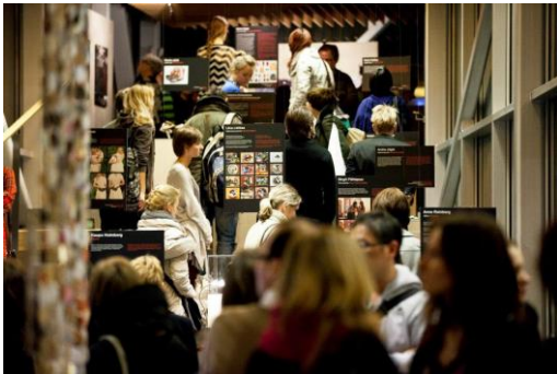
*衛星展—愛沙尼亞藝術學院學生作品展。