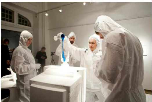
*衛星展—A5 藝術團隊行為表演。