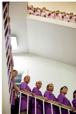
*動態走秀展演。 *開幕走秀展演。