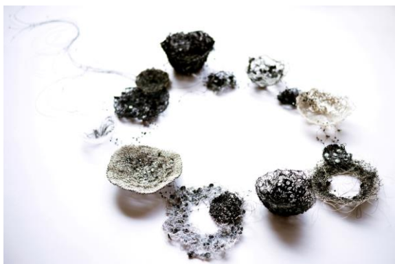
*筆者展出作品—軌跡 Trace。