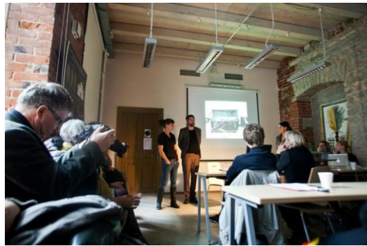
*A5 團隊創作者講述其行為藝術概念。