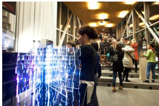
*位於占領博物館的衛星展。