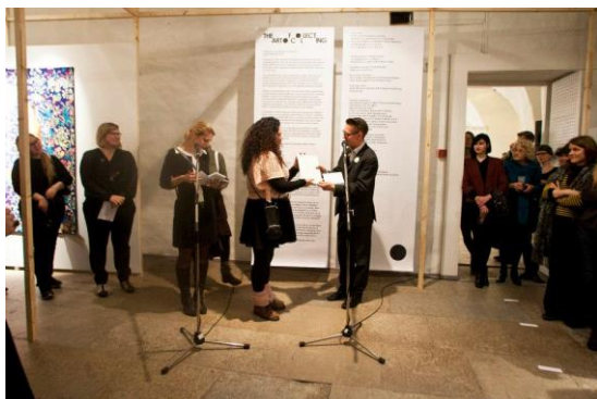
*三年展開幕式暨頒獎典禮。