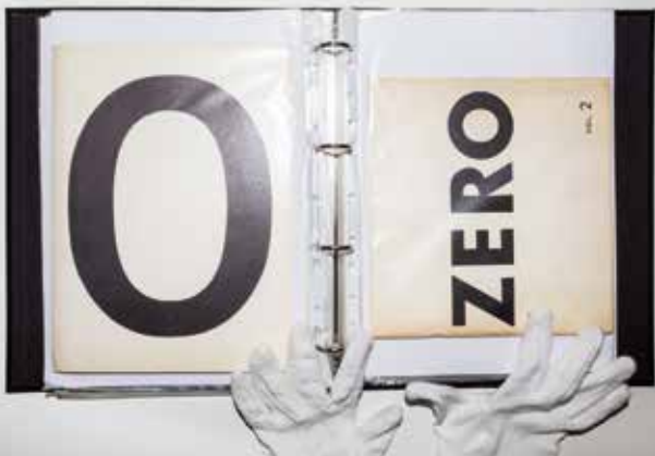
Zero 2 Publication, Archiv der Avantgarden, Japanisches Palais, Dresden, 2019

An unrealized draft for a work from Robert Barry, a motorbike developed by the designer Philippe Starck, texts and publications from the group ZERO: The Archiv der Avantgarden consists of artistic works and drafts, letters, photographs, everyday and design objects from the 20th century. Amongst its holdings, it includes collections of Bauhaus objects, photographic records of the Fluxus movement, documents of the Polish Futurists and magazines from the international labour movement.