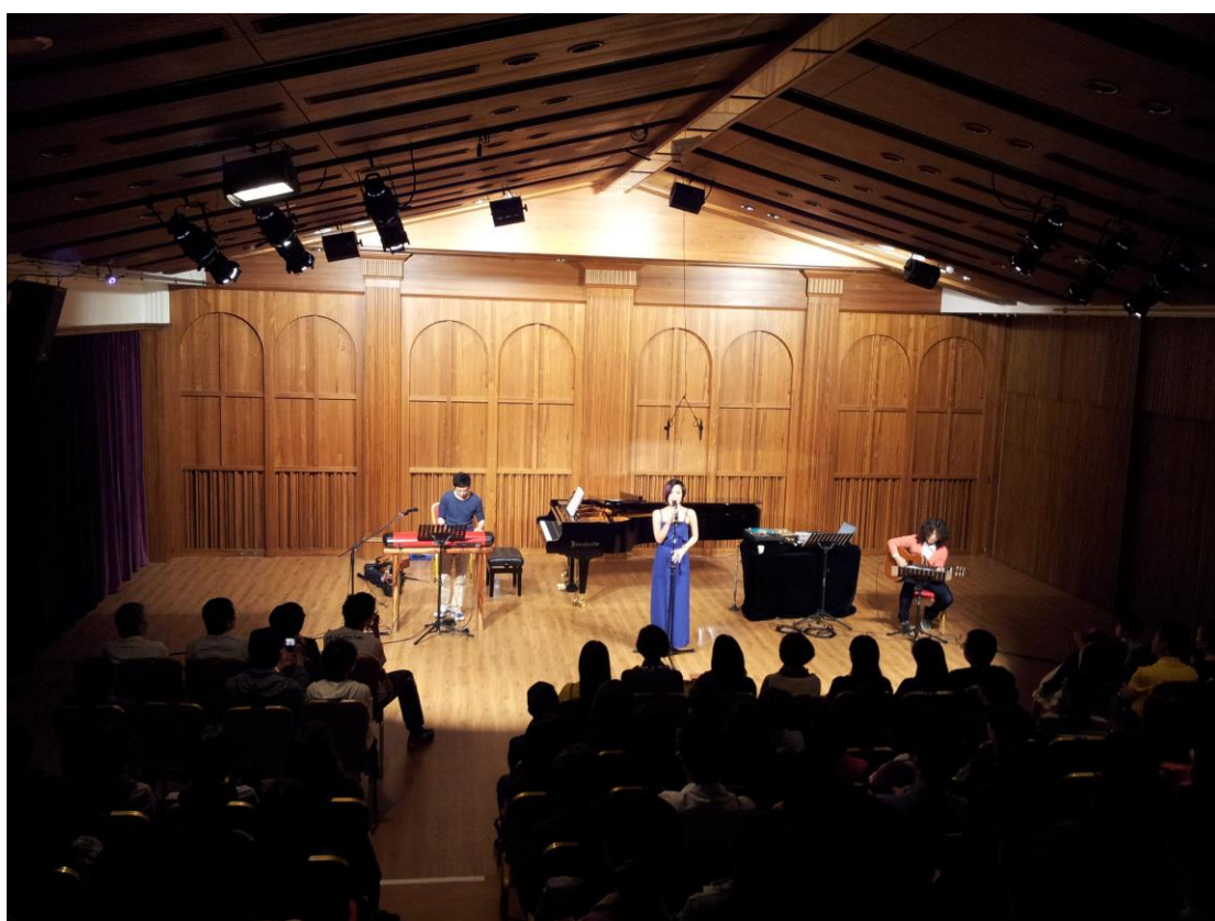
涇莎永華館音樂會場景↑