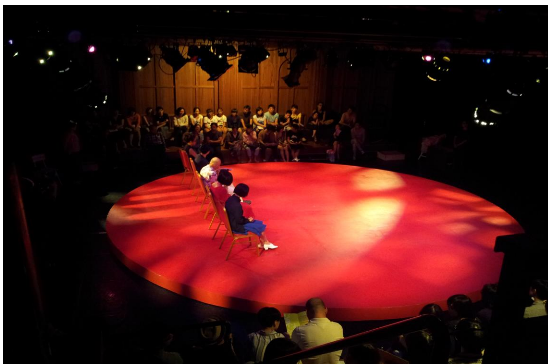
戲劇類展演(黑盒子舞台)場景，觀眾席及台階平台皆可變動 ↑