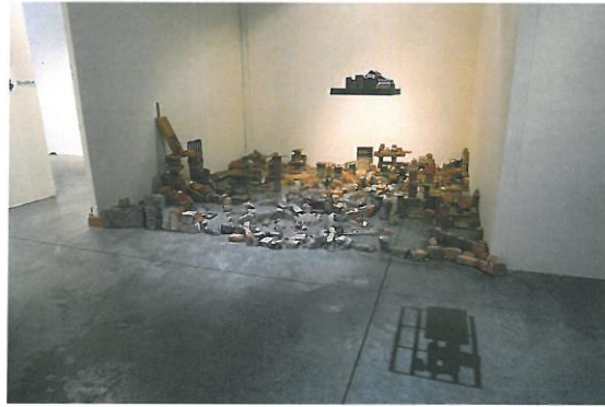
陽台城市系列-積木城市語錄移地計畫&地點：高雄駁二倉庫 I 2014 依場地而定 積木、石塊、磚塊等媒材