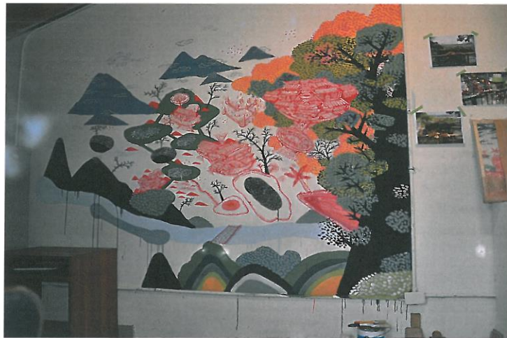
陽台城市文明移地計畫&地點：寶藏巖 II 2014 依場地而定 壓克力、水泥漆等媒材

陽台城市文明移地計畫，以寶藏巖為建構城市文明想像的藍本，寶藏巖這個地的聚落形成，是有機的形成方式，隨著時間、歷史、人的流動與變化，因此我有了自己在觀察後對寶藏巖新的想像樣貌，我用地圖誌的方式去重新繪製寶藏巖圖，主要是想要表達一種超越當下時、地情感與記憶的混合體，其實也就是要表達在城市當中人們現實與非現實之間的交疊與錯覺。寶藏巖圖誌不只是在製造，其實也是對寶藏巖或是真實生活的城市當中對城市的「巨觀」與「微觀」的觀看之後，把既有許多構成城市的元素，