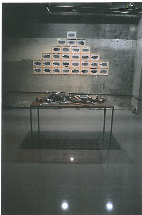
複製城市的傳說之陽台城市文明語錄 2014 依場地而定 積木、鋁、紙張、代針筆、墨水等媒材

重新解構與再組構，再透過生活上的體悟，然後以有如「說故事」的方式重新講述一個身體感與繪畫語言的敘述性烏托邦的想像。