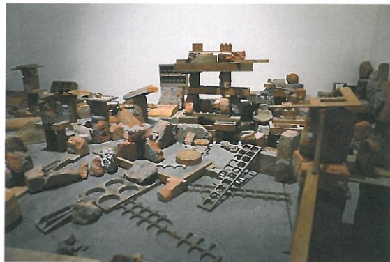
陽台城市系列-積木城市語錄移地計畫&地點：高雄駁二倉庫 II 2014 依場地而定 積木、石塊、磚塊等媒材

搜集高雄駁二倉庫拆除磚塊與石材與積木模具（磚塊、石材與積木是我對居處空間與城市中建物的回應），在倉庫的展場空間中，重新再作發想，與倉庫這個空間作對話，所建築的文明城市。