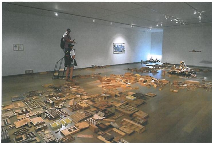
陽台城市系列-積木城市語錄移地計畫&地點：信義誠品 II 2014 依場地而定 積木、鐵、鋁等媒材

選擇以台北都市精華地段信義區作為移地計畫的呈現地點，主要以此地為中心（台北 101 在信義誠品的附近），重心建構一個新的台北城的想像。