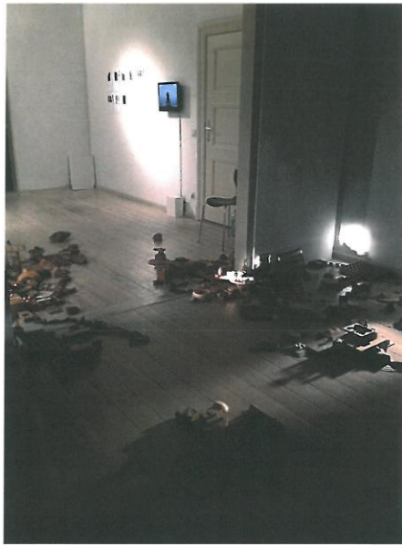
陽台城市系列-積木城市語錄移地計畫&地點：德國柏林 2014 依場地而定 積木、石塊、磚塊等媒材

德國柏林市 GlogauAIR 藝術村是二戰時被炸掉留下的小學校的體育館，我在柏林駐地創作時，便以 GlogauAIR 藝術村為中心，以勞動的方式開始蒐集柏林二暫時被炸掉建築物遺留下的石材與建物，結合我從台灣帶去的積木模具，從新建築出我對新柏林的想像的城市。