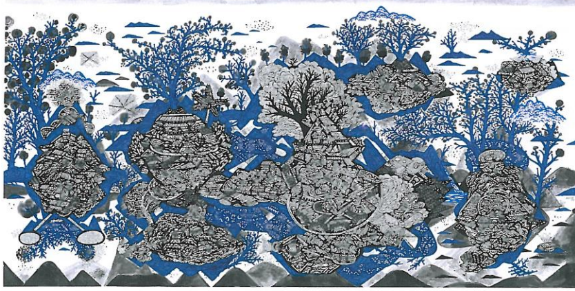
陽台城市文明誌-被藍樹圍繞的城市傳說 2014 40X70公分 紙、代針筆；水彩、墨水等複合媒材