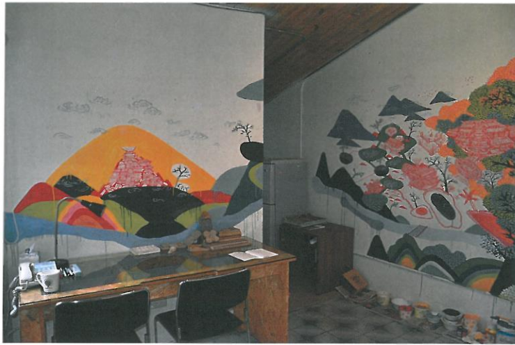
陽台城市文明移地計畫&地點：寶藏巖 I 2014 依場地而定 壓克力、水泥漆等媒材