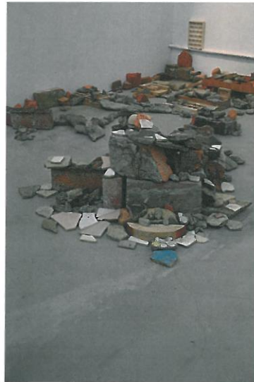
陽台城市系列-積木城市語錄移地計畫&地點：寶藏巖 II 2014 依場地而定 積木、石塊、磚塊等媒材

寶藏巖的特殊的歷史與故事性，在駐村期間，我試圖不斷的很勞動性的去觀察與走繞寶村（因為過程有很很身體感的勞動狀態，心理與身體在過程中也將之投射在寶藏巖這個聚落的真實身體感之中），因此，在這駐村的過程中使我在創作的思維上重新建構並賦予新的價值與意義，並在寶藏巖這文化紋理與故事性如此強烈的聚落當中，開始有了烏托邦的想像，在駐村的過程中開始積極呈現自我與對駐村環境的存在狀態與個人對環境感受與消化後的心像投射，再造出我所想像新的城市風景。