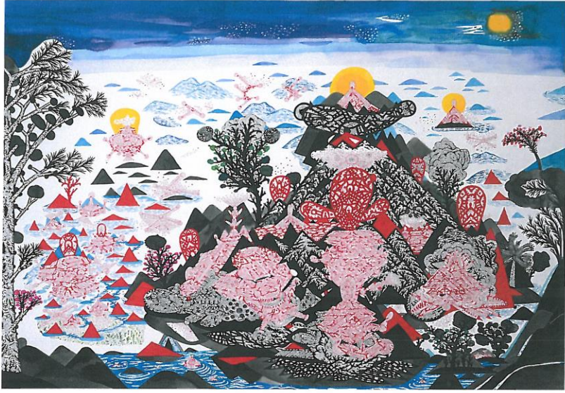
陽台城市紅色文明系列-日夜發光的神境 2014 79X110公分 紙、代針筆；水彩、墨水等複合媒材