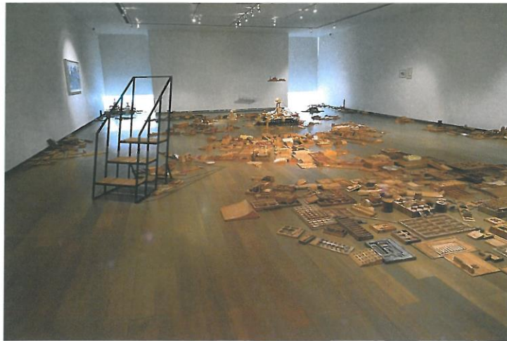
陽台城市系列-積木城市語錄移地計畫&地點：信義誠品 I 2014 依場地而定 積木、鐵、鋁等媒材