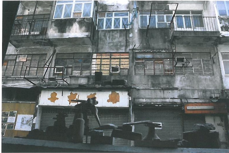
陽台城市系列-積木城市語錄移地計畫&地點：香港 2014 依場地而定 積木媒材

香港這個地方是陽台城市實在再貼切不過了，在旅行的過程中，這地方給我的回饋正如一連串流離失所的都會傳說，在樓愈建愈高的同時，住樓的人被自己的房子溢出了，甚至無立足之處。香港對我來說又像是一種無根與沒有確切的狀態，這種狀態可從權力的分配的失衡一路延伸到主體性的喪失，一種發生在都市中各個角落再平常不過的一個事